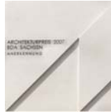
BDA-Preis Sachsen Anerkennung 2007